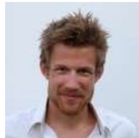
Bernhard Sieber Olympiateilnehmer