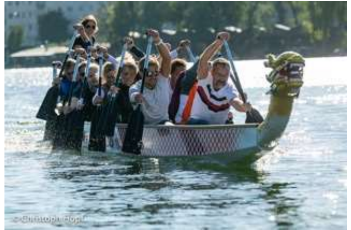
Rhythmus im Team erlebbar machen