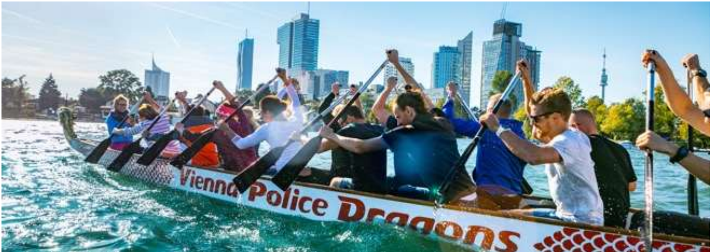
Drachenboot - Einzigartige Methode zur Team- und Organisationsentwicklung