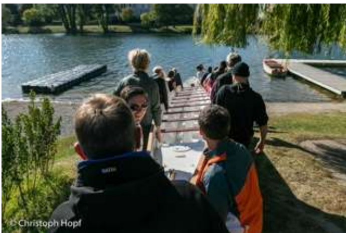
Teamaufgaben - am Wasser und an Land