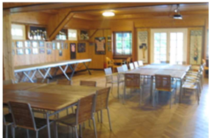
LIA Ruderclub - Alte Donau