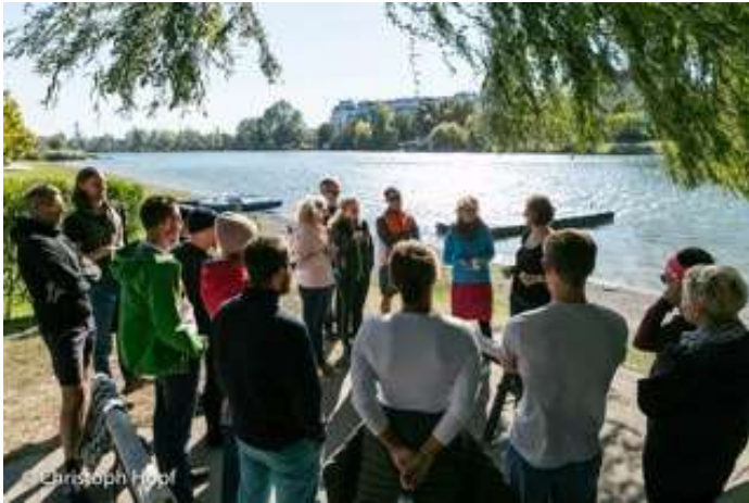
Polzeisportverein - Alte Donau